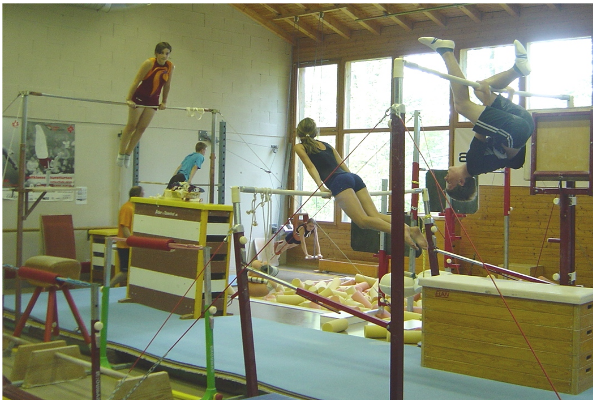
Die Grossen im Turnparadies in der Kutuhalle.

Sommerferien-Training Montag 7. bis Freitag 11. August, 18.00 - 19.30 Uhr im Kirchacker